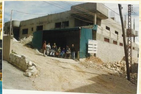
Les étapes de construction du « Foyer de Tendresse » - Anta Akhi au fil des années